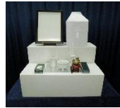
後飾り祭壇・仏具