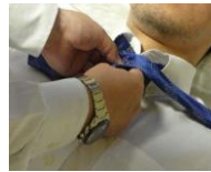
仏衣一式・旅支度